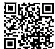
QR Code สิ่งที่ส่งมาด้วย ๑ - ๔