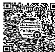
QR Code ไลน์กลุ่ม “ติดตามเด็กออกกลางคัน สนม.”